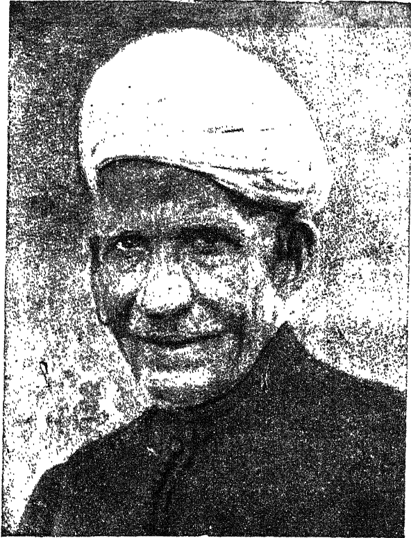
राजा बलदेवदास बिड़ला