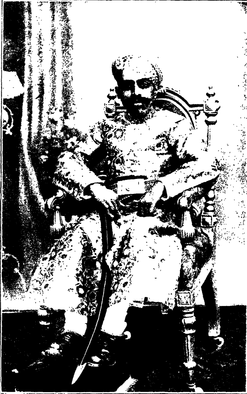
श्रीमान् महाराजाधिराज महाराणार्जो श्री सर भूपालसिंहजी बहादुर, जी. सी. एम. आई., के. सी. आई. ई.