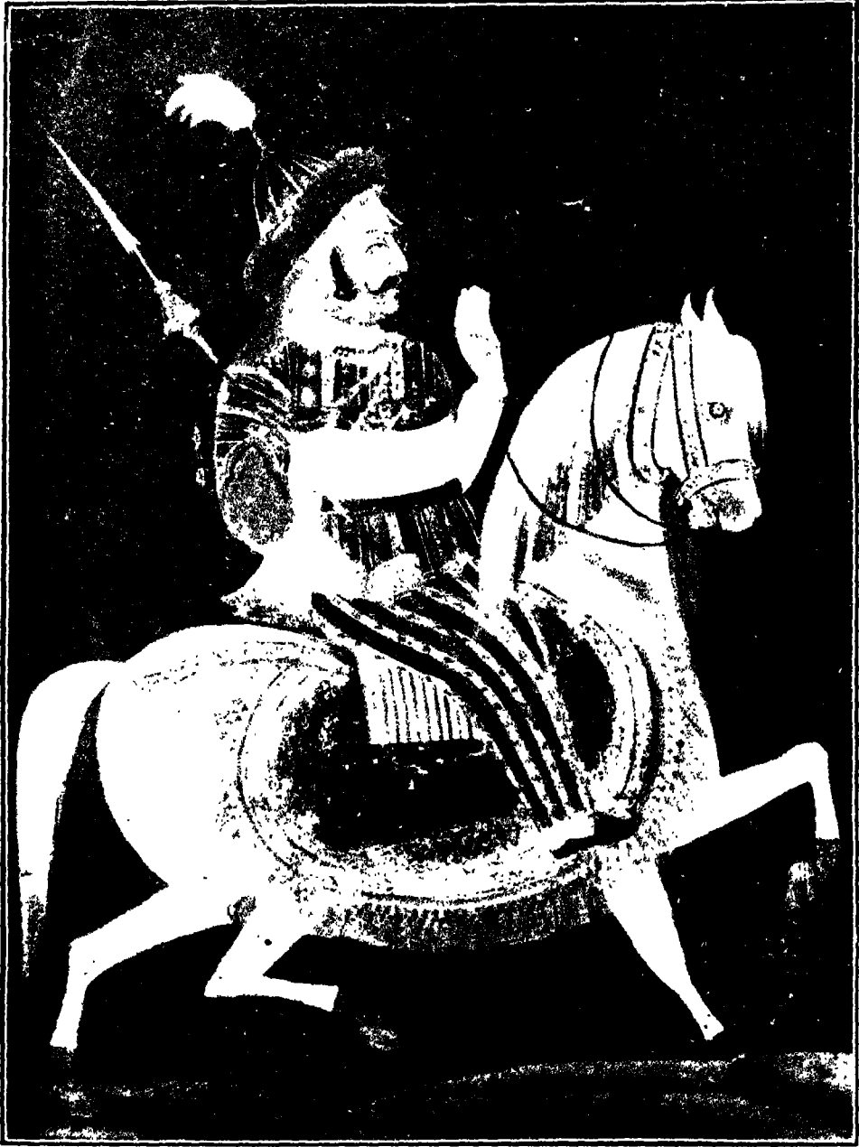
रावत दूदा ( सांगायत )