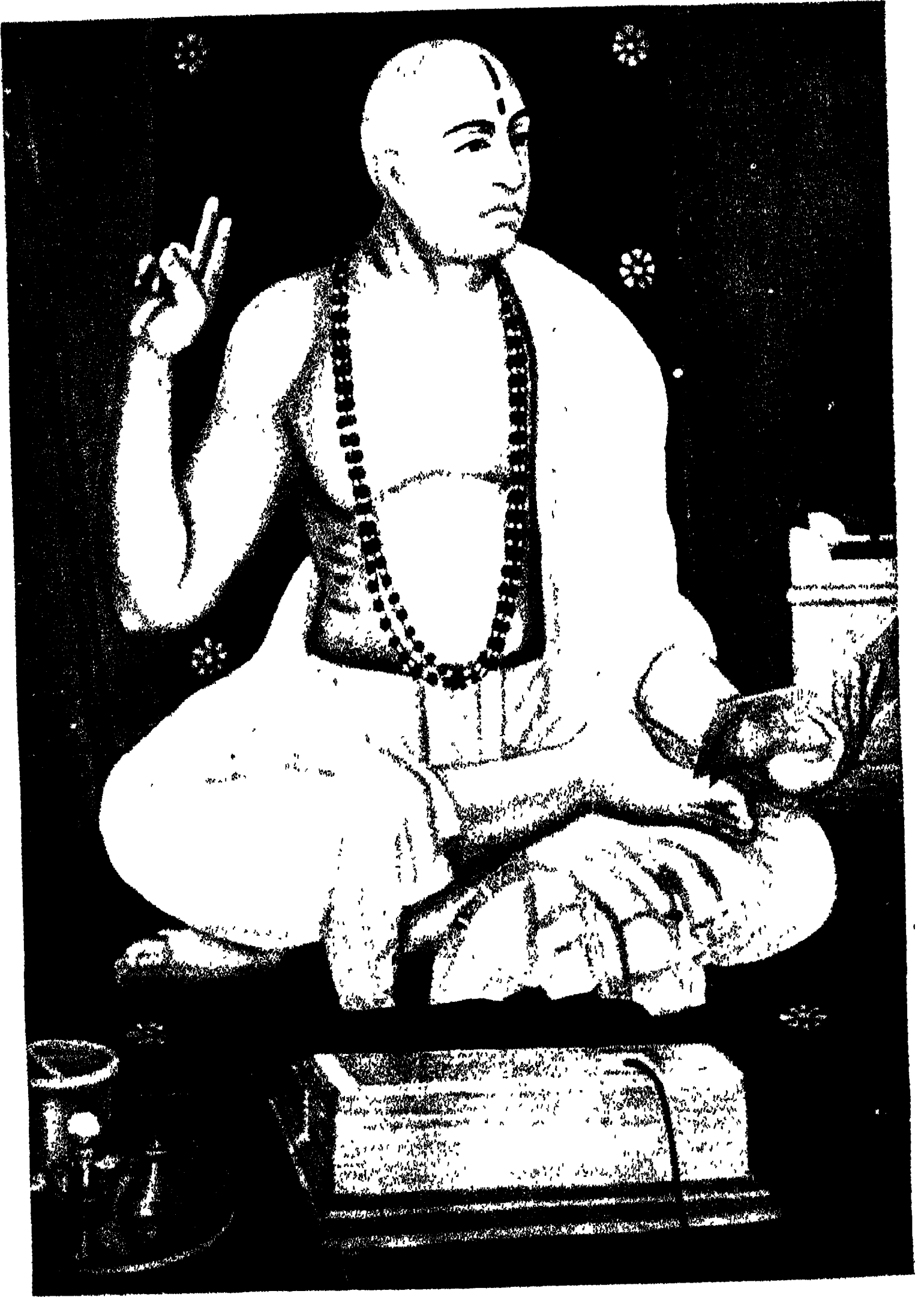
श्रीमान्, अनन्तशयैर्ष वा श्रीमान्, मन्त्राचार्या