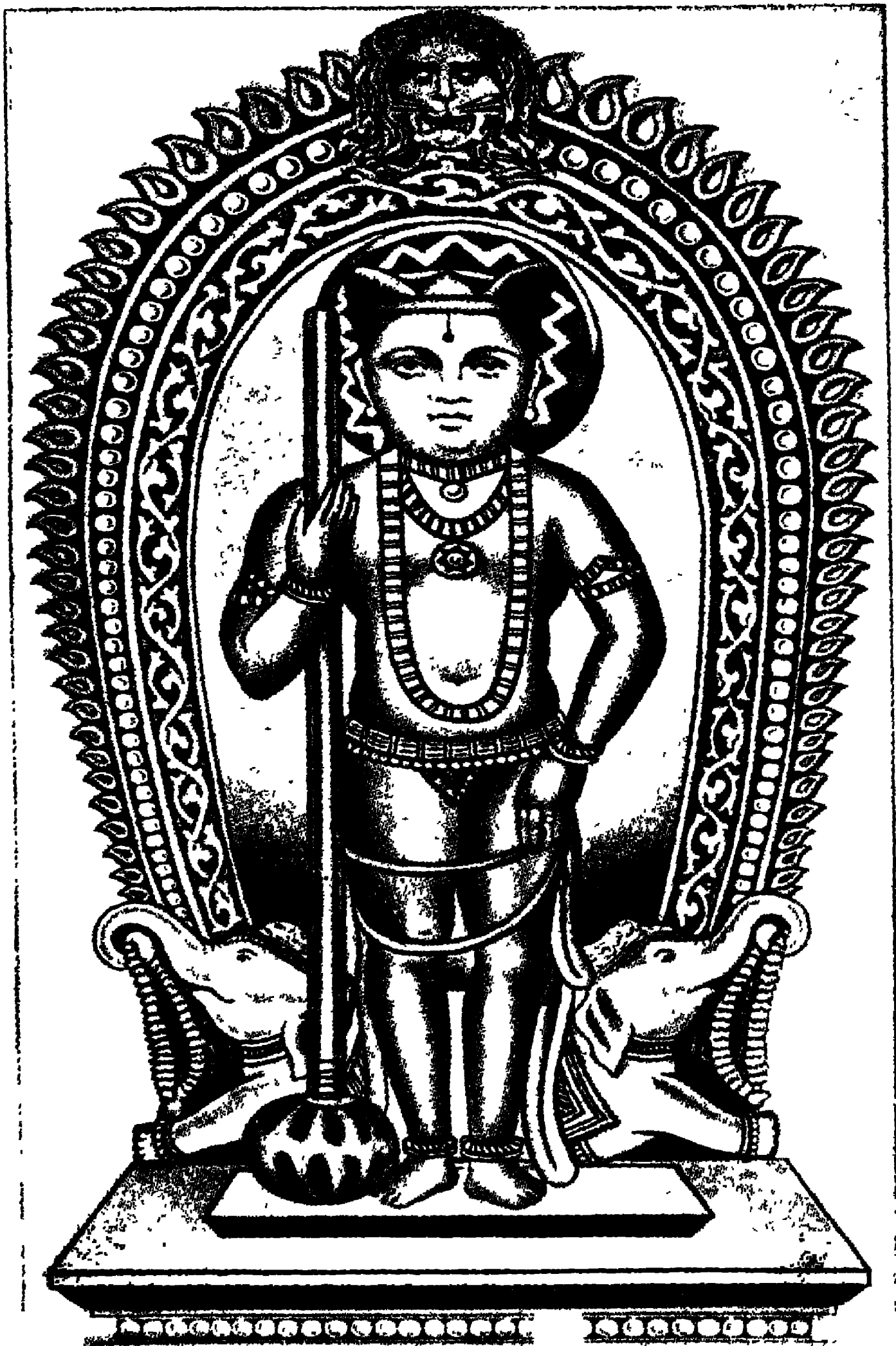
• শ্রীমধ্বাচার্যের সেবিত শ্রীবালগোপাল