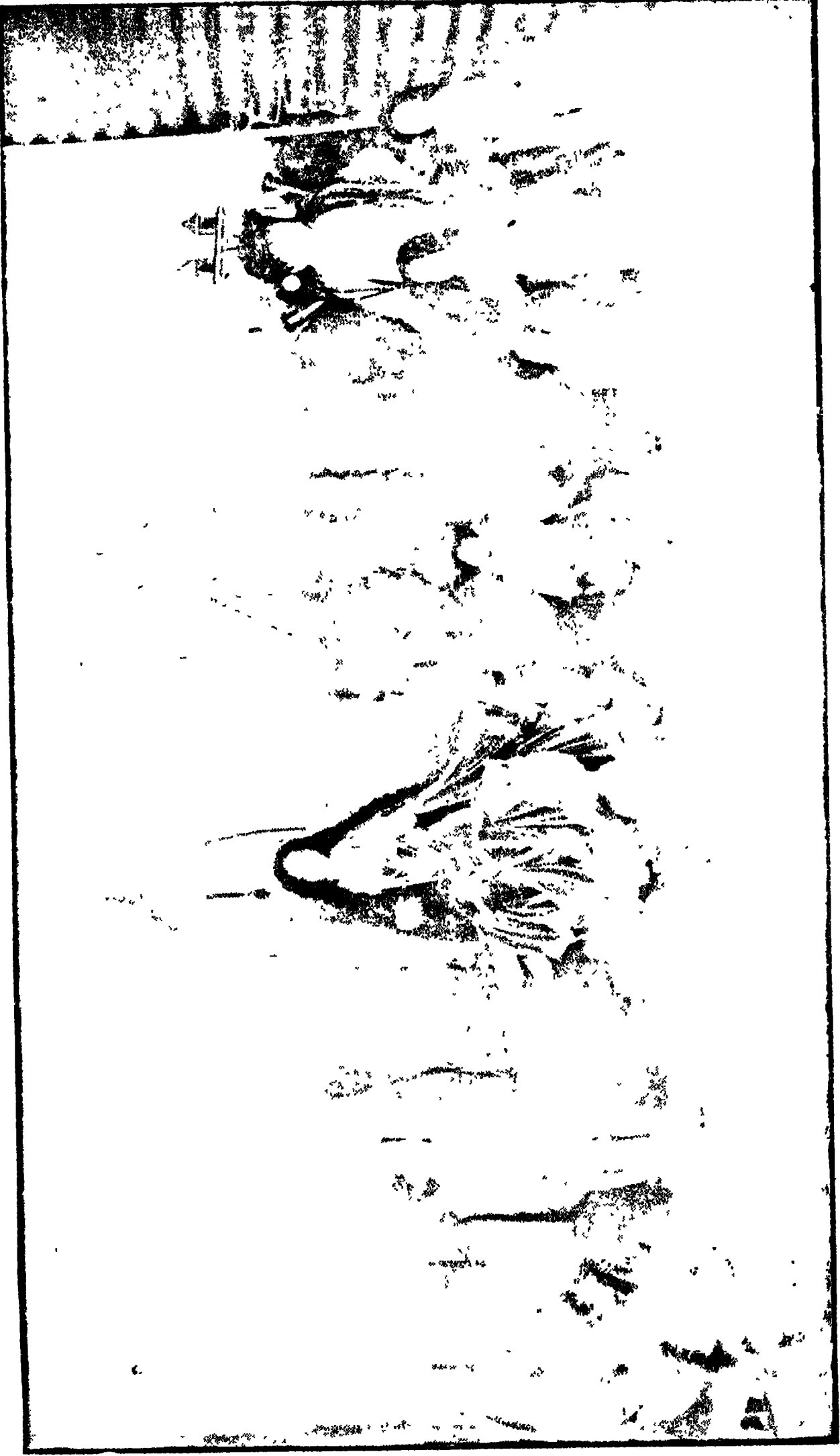
শ্রী-ব্রহ্ম-রুদ্র ও সনক-সম্প্রদায়ের মূলপ্রবর্তক চতুষ্টয়